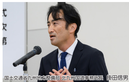
国土交通省九州地方整備局 北九州国道事務所長 掛田信男