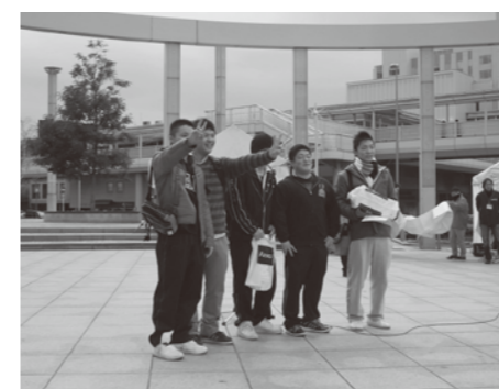
若松高等学校チーム