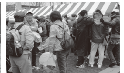
開始前の作戦会議