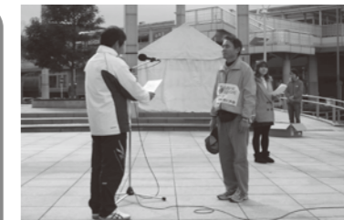
高坊2丁目南町内会