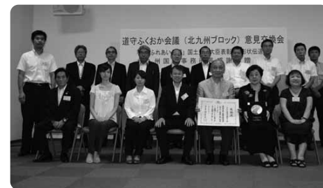
快挙！今年で2度目の受賞

「別に感謝状をもらうために活動したわけじゃないけどね」と団体さんのお1人は恥ずかしそうにつぶやいておられました。ボランティアといっても、朝晩、暑い日も寒い日も皆さんがコツコツ活動されておられること、並大抵ではありません。事務局としては、すべての団体さんのパワーが国土交通大臣表彰受賞につながったと信じています。おめでとうございます。