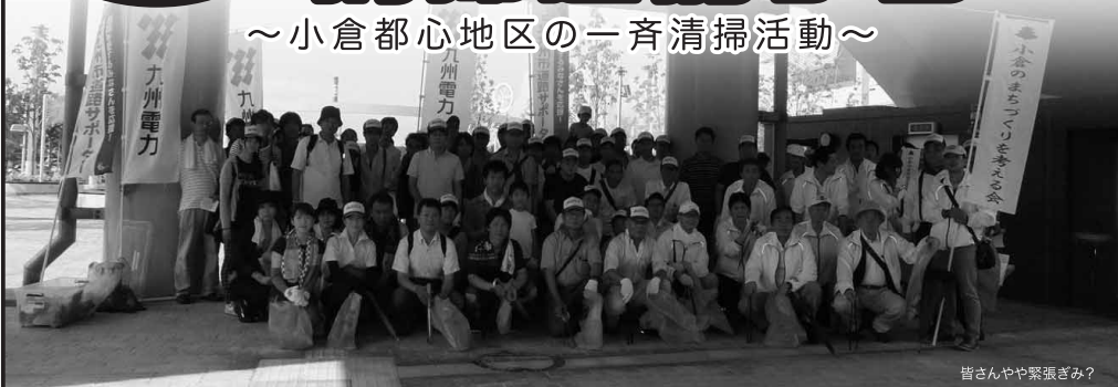
皆さんやや緊張さみ？