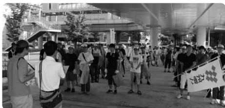
気合は十分の出発式

本番となった7月のとある土曜日に、小倉都心地区で活動する9団体が合同で清掃活動を行いました。夕立が降った後の蒸し暑い日でしたが、出発地の「あさの汐風公園」から「ゴール地点の勝山公園大芝生広場」までの範囲を、それぞれのルートに分かれて担当しました。