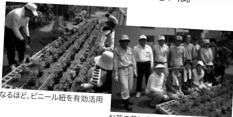
なるほど、ビニール紐を有効活用

夏場の水やりは大変ですし、ご苦労も多いと思いますが、これからも地域の癒しスポットとして私たち通行人のハートを潤ってくださいね。