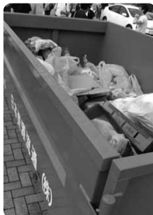
都心部には意外と少ない？ …でもしっかり集めました