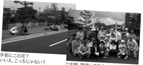
手前にこの花? いいえ、こっちじゃない?

宮田町1丁目自治会さんは、道路サポーター活動を始めたばかり。初々しく、でも、人生のベテラン揃い、頼もしいです。これで、小倉北区木町から続く沿線では、4つの団体さんによる四季折々に楽しいフラワーロードができました。