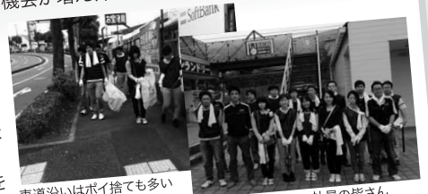
車道沿いはポイ捨ても多い

清掃活動をする地域の方とあいさつや会話をする機会が増え、社員一同とても満足しています。