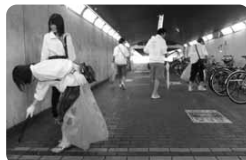
自転車のマナーにだって、目を光らせますよ

こうした団体の垣根を越えた清掃連携のナイスプレー。今回は小倉北区の皆さんでしたが、市内各区でも企画してみたいですね。交流ができてお友達が増える、みんなの目的が「私たちの町、きれいになれ！」という一心なので、気持ちもひとつになれる。道路がきれいになって、清々しい。マナーアップの啓発になるなど、一石二鳥といわず、三鳥、四鳥にいいことがありそうですね。