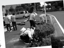
樹木の間も彩りよく

「私たちは素人だから」と活動中のボランティアさん。とんでもありません。手際もよく、お手入れもさすがの腕前です。道行く人もホームの利用者も方も、思わず心細み、笑顔がこぼれます。