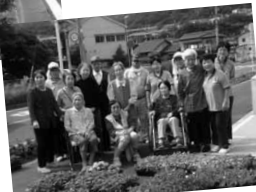
沢山の花苗、これからが楽しみ